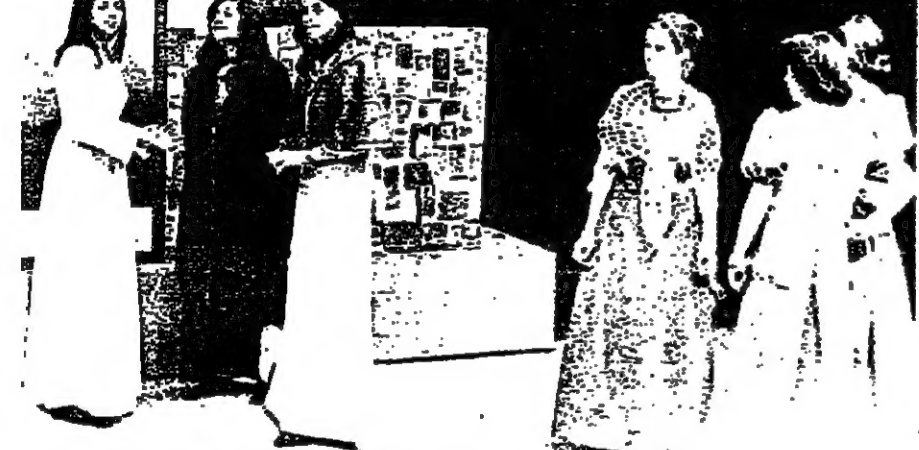
الطالبات الممثلات في احد مشاهد المسرحية

قام بالدور الرئيسي في المسرحية نبيل شحاتة الطالب في الكلية في فرح القنون الجيلة السذي احسن أداء دور «سكروج» بشكل مضحك ومغيب.